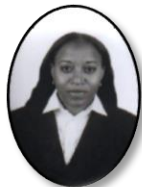
Milagro de Jesús Ruiz