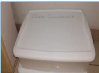
Clase: Computación I | Ing. David Ordoñez 2 Cajas de Almacenamiento | II