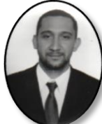
Erick Orlando Morales Aguilar